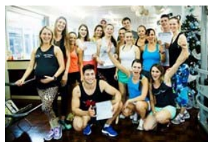
Coluna Gente 28/12 (/imagens/galeria/2014/12 /coluna-gente-2812/31764/)