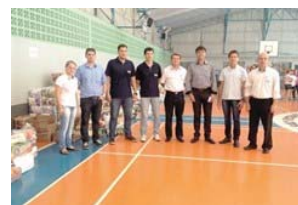
Coluna Acontece 28/12 (/imagens/galeria/2014/12 /coluna-acontece-2812/31765/)