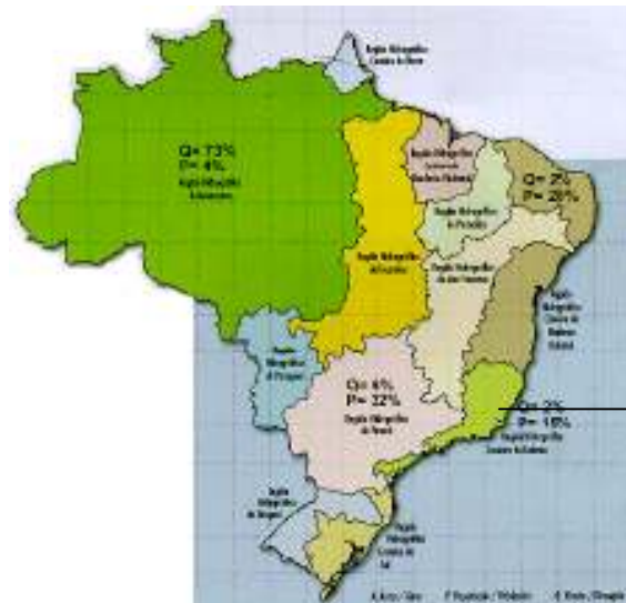
Bacias Hidrográficas Brasileiras