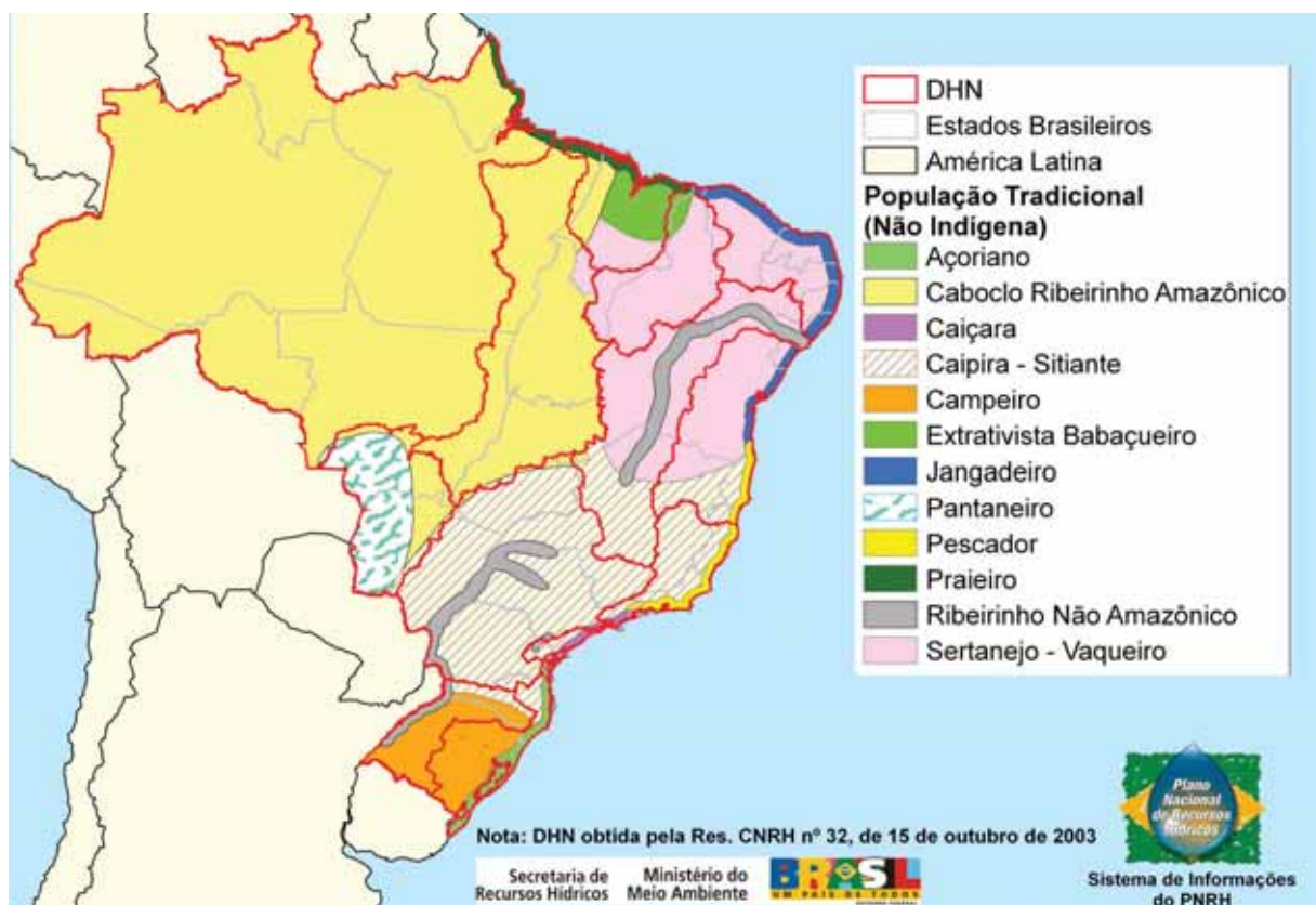
FIGURA 9.2 – Populações tradicionais não indígenas no Brasil